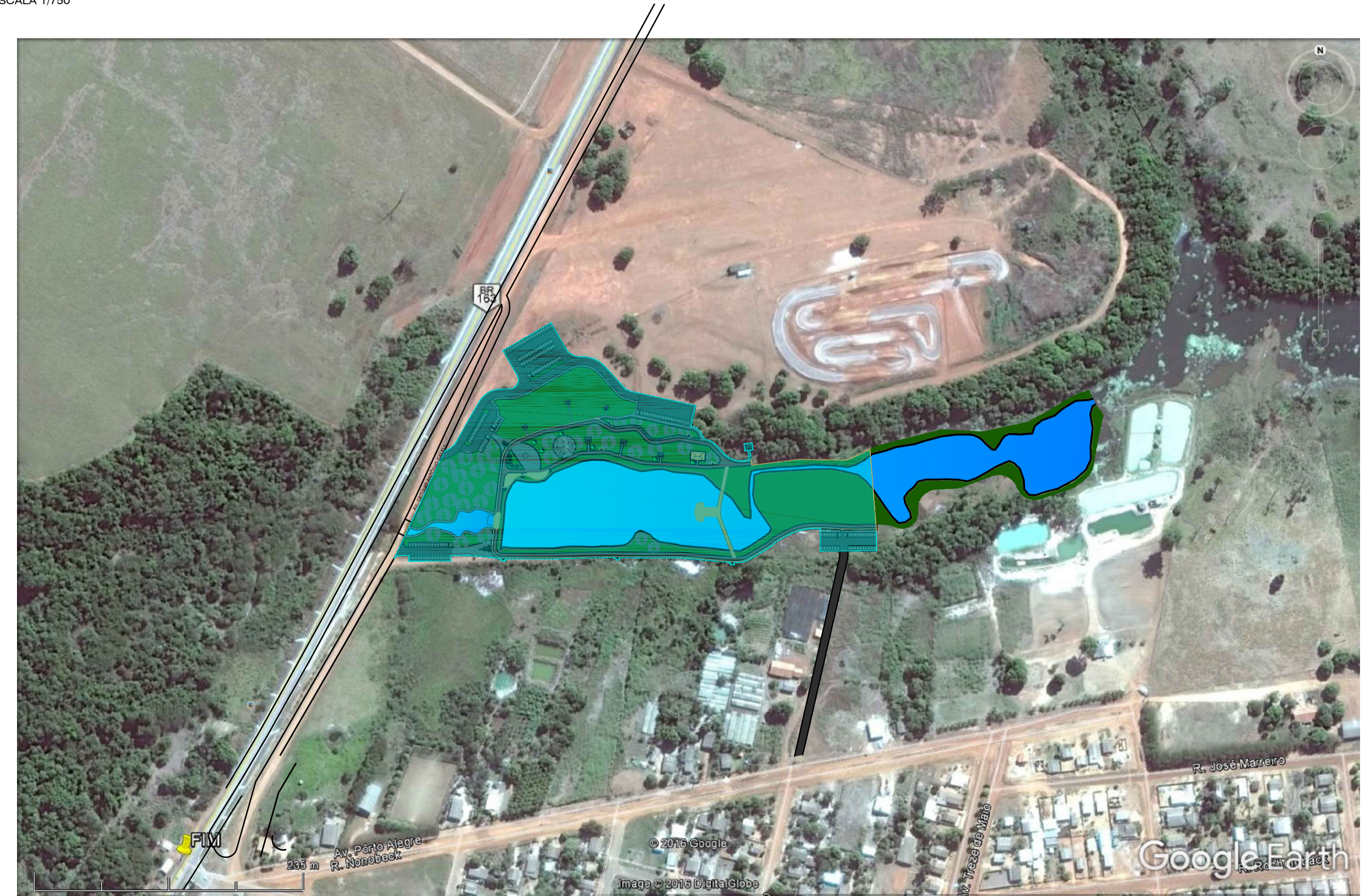
SETORIZAÇÃO SEM ESCALA